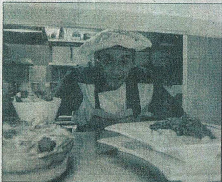
Dans ce charmant restaurant, vous pourrez déguster les innombrables pâtes maisons.