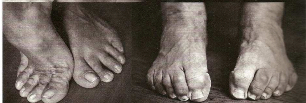
"Isabel Marant... C'est la beauté sans la perfection." "Pierre Hermé a des pieds d'oursin, tout dans la retenue, comme..."